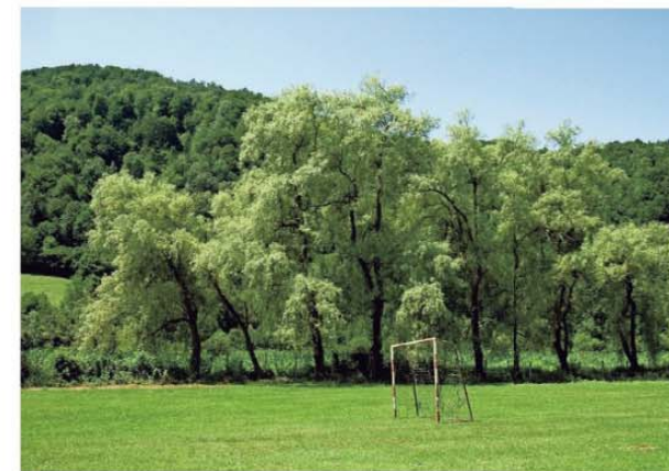
● Op het voetbalveld in Nova Kasaba werden ruim 1.500 moslims (mannen en jongens) vermoord.

Enduring Srebrenica, Kazerne Dossin, 11 juli tot 11 november, dagelijks, woensdag dicht. Het gelijknamige boek kost 22 euro.