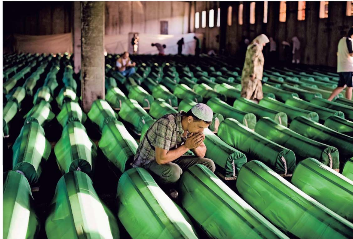
● In Srebrenica duren de begrafenissen voort. Elk jaar worden op 11 juli menselijke resten, door DNA-onderzoek samengebracht, begraven en herdacht.

In Kazerne Dossin in Mechelen opent op 11 juli 'Enduring Srebrenica', een fotografisch project van de Nederlandse-Duitse fotografe Claudia Heineremann over de massamoord op Bosnische moslims tijdens de Joegoslavische oorlog. 'Wie ben je nog als je man en kinderen niet eens een graf hebben?' Catherine Vuylsteke